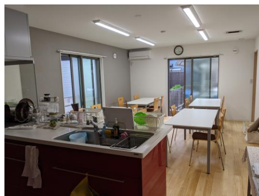
1F作業室とオープンキッチン