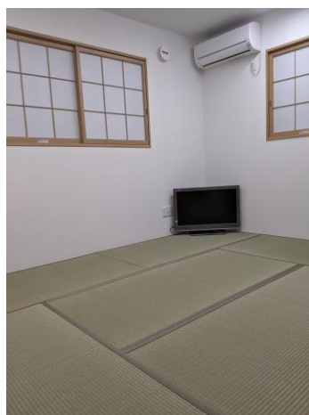
2 F 静養室